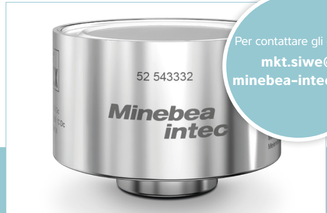
La cella di carico PR 6212 fornisce risultati altamente accurati in tempo reale

Per contattare gli esperti mkt.siwe@minebea-intec.com