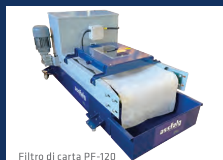
Filtro di carta PF-120