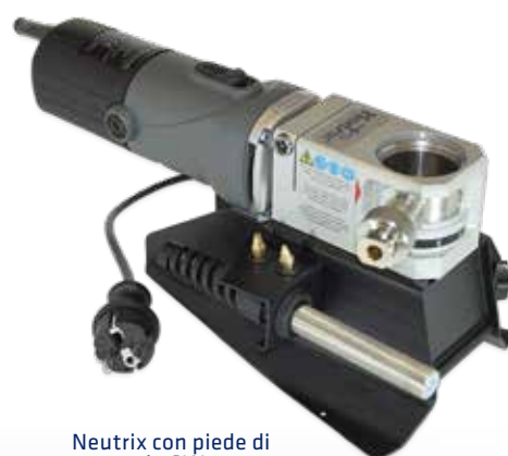
Neutrix con piede di appoggio SW

Neutrix è una rettificatrice piccola, leggera e portatile in grado di lavorare in posizione centrica in direzione longitudinale con estrema precisione e qualità riproducibile su elettrodi di tungsteno. Per l'utilizzo in officina, è possibile montarla su una base di appoggio.