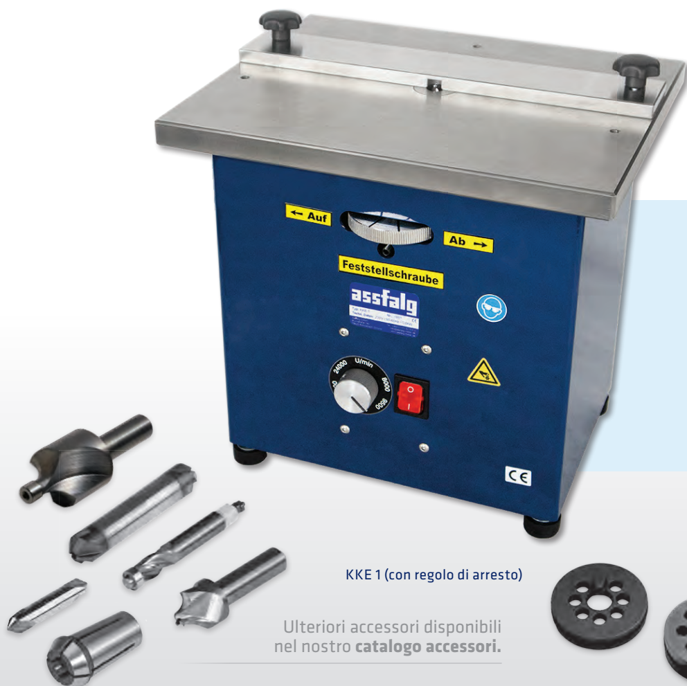
KKE 1 (con regolo di arresto)

Ulteriori accessori disponibili nel nostro catalogo accessori .