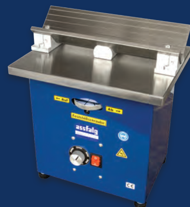
KKE 2 (con prisma)