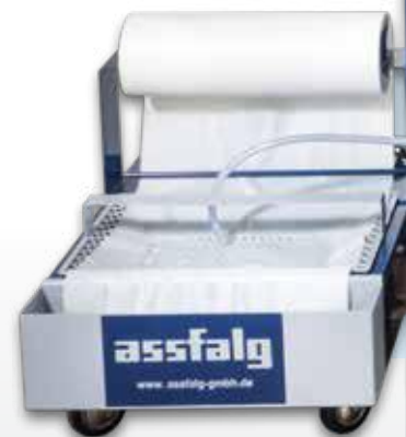
Filtro di carta PF440

Bordi e superfici di pezzi dalle forme più differenti vengono lavorati in assenza di un operatore. Più grande è l'elemento abrasivo, più veloce è il processo di sbavatura.