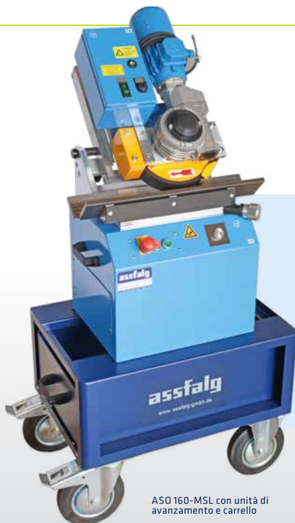
ASO 160-MSL con unità di avanzamento e carrello