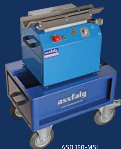
ASO 160-MSL con carrello