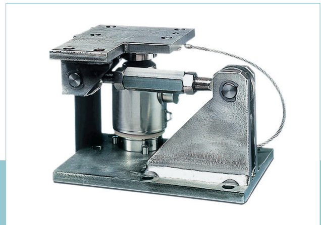
I kit di montaggio Mini FlexLock neutralizzano le forze di sollevamento orizzontali e verticali