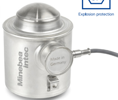
Inteco rappresenta un'evoluzione coerente delle collaudate celle di carico Minebea Intec

Per contattare gli esperti sales.uk@minebea-intec.com