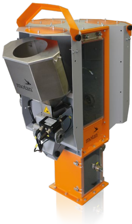
Sistema a cambio rapido