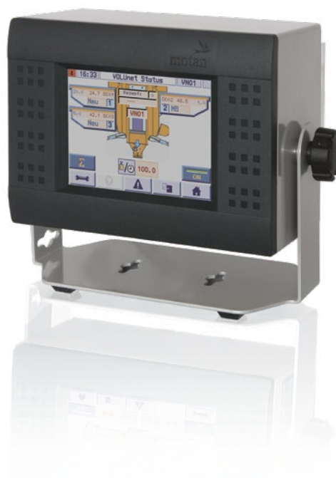
P205 con VOLUnet SC

L'eccezionale principio della miscelazione a caduta di motan consente un elevato livello di ripetibilità nel mescolare i componenti a monte dell'estrusore. Questa caratteristica ricopre un ruolo chiave nell'ottenere una perfetta plasticizzazione e omogeneizzazione dei materiali.